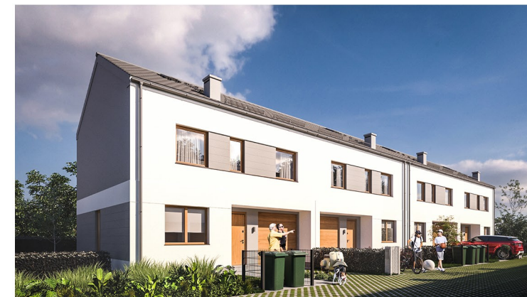
WIZUALIZACJA BUDYNKÓW 3 I 4 OD STRONY FRONTÓW