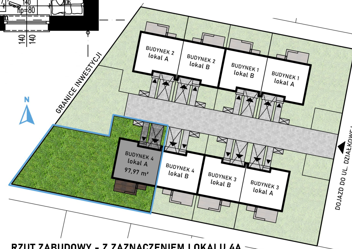
RZUT ZABUDOWY - Z ZAZNACZENIEM LOKALU 4A