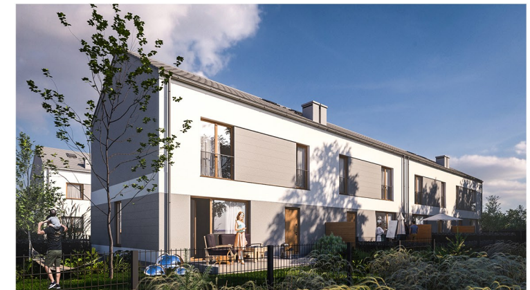
WIZUALIZACJA BUDYNKÓW 3 I 4 OD STRONY OGRÓDKÓW