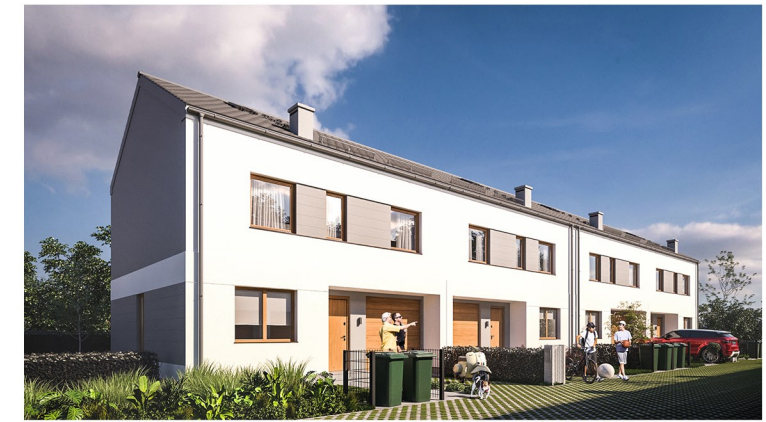
WIZUALIZACJA BUDYNKÓW 3 I 4 OD STRONY FRONTÓW