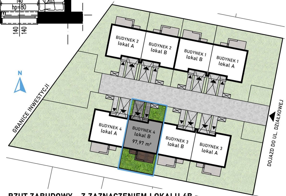
RZUT ZABUDOWY - Z ZAZNACZENIEM LOKALU 4B

Obliczenia powierzchni użytkowych pomieszczeń lokalu zostały wykonane zgodnie z rozporządzeniem Ministra rozwoju z dnia 10 sierpnia 2022 r. w sprawie szczegółowego zakresu i formy projektu budowlanego (Dz.U. 2022 poz. 1679) oraz normą PN-ISO 9836:2015-12. W ramach indywidualnych zmian lokatorskich możliwa jest modyfikacja lub demontaż ścian niebędących ścianami konstrukcyjnymi oraz inne zmiany niewymagające pozwolenia na budowę, pod warunkiem ich zgłoszenia z wyprzedzeniem, na odpowiednim etapie harmonogramu budowy. Elementy aranżacji lokalu mają charakter poglądowy i nie wchodzą w zakres standardu wykończenia.